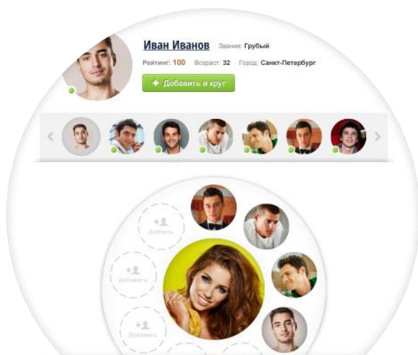
У девушки только один круг мужчин

Основной элемент сервиса – Круг, в центре которого находится женщина среди определенного ей числа добивающихся ее мужчин. Женщина одновременно может поддерживать только один круг для выбора мужчины, а мужчина может присоединиться ко множеству кругов женщин. В кругах происходят различные активности, которые позволяют женщине постепенно избавляться от нежелательных мужчин и поощрять понравившихся. В круге ограничено количество участников и время его существования.