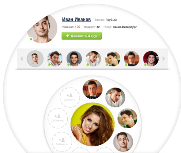
У девушки только один круг мужчин

Основной элемент сервиса – Круг, в центре которого находится женщина среди определенного ей числа добивающихся ее мужчин. Женщина одновременно может поддерживать только один круг для выбора мужчины, а мужчина может присоединиться ко множеству кругов женщин. В кругах происходят различные активности, которые позволяют женщине постепенно избавляться от нежелательных мужчин и поощрять понравившихся. В круге ограничено количество участников и время его существования.